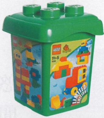
| Lego 幼兒積木 20 印仔 |