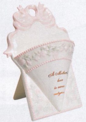
| 座枱式花瓶 6 印仔 |

周末市集時有以物易物地攤，鼓勵大家減少浪費及不必要消費，但活動多數一次性或非定期，想繼續捐予或交換合心水物品，機會可遇不可求。至於網上二手物件交易平台，有人始終覺得見實物真身，才清楚物品是否合心意。終於，香港有以物易物實體店——「換意」，凡帶來九成新淨貨品，可換成蓋印，儲夠印仔即可換取店內心儀物品，零消費，支持環保。