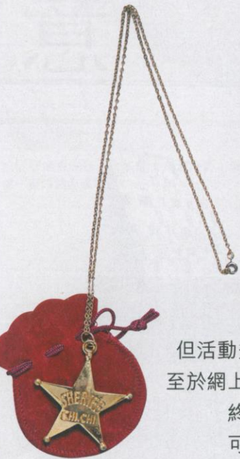
| 星形頸鍊 3 印仔 |

text | Eunice photo | Sing edit | Edmundo art | N