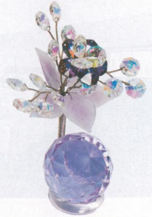
| 小擺設 4 印仔 |