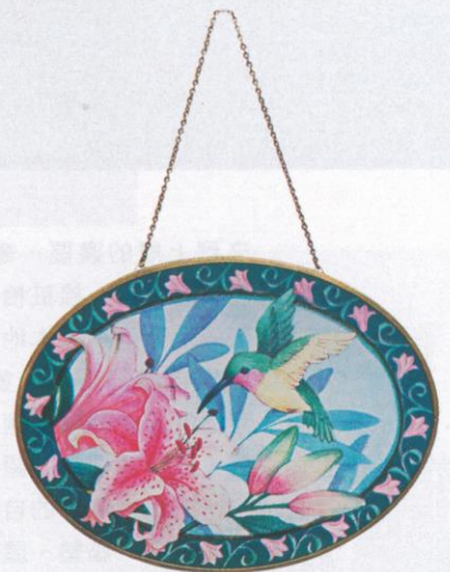
| 玻璃掛飾 20 印仔 |