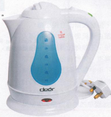
| 電熱水壺 30 印仔 |