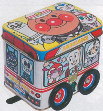
| 麵包超人鐵玩具車 3 印仔 |

text | Eunice photo | Sing edit | Edmundo art | N