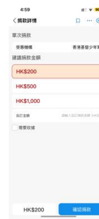
4) 選擇/輸入捐款金額及按「確認捐款」