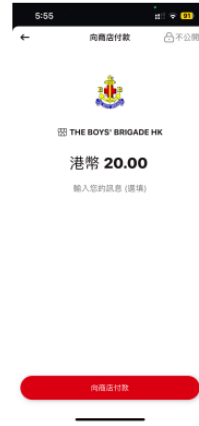
4) 確認捐款金額及按「向商店付款」

捐款總額HK$100或以上可申請扣減稅項，如需要收據，請把「確認頁面」截圖(須顯示付款日期)WhatsApp至6753 4175，以便開發收據。