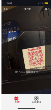
2) 掃描旗袋上的PayMe二維碼