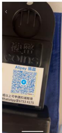
2) 掃描旗袋上的Alipay二維碼