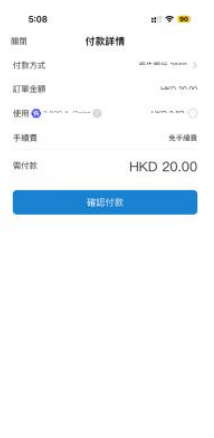
5) 按「確認付款」輸入支付密碼，即可完成交易

捐款總額HK$100或以上可申請扣減稅項，如需要收據，請把「確認頁面」截圖(須顯示付款日期)WhatsApp至6753 4175，以便開發收據。