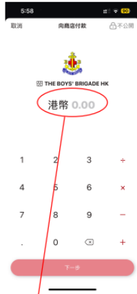
3) 輸入捐款金額，並按下一步