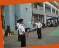
隨著指揮杖一揮，今次又完成任務了！