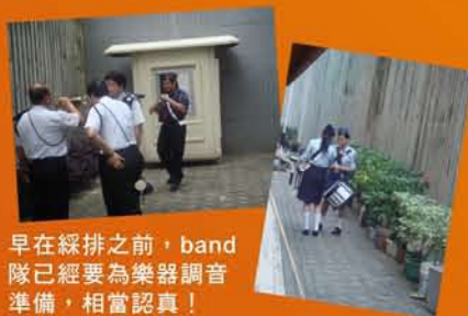
早在綵排之前，band隊已經要為樂器調音準備，相當認真！

每次BB的大型活動，我們都會見到Band隊為我們演奏，今次Band隊又去到九東試辦區的領袖訓練結業禮及週年慶典。