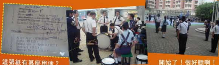
這張紙有甚麼用途？

長期練習耳朵會不會勞損？ 未聽聞過有隊員的耳朵出現問題，因為練習時會刻意控制音量！