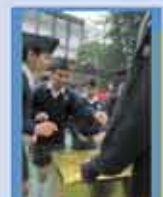
隊員們將親自寫上的祝福語放到收集箱中。