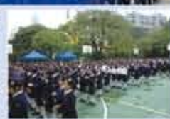
隊員們隨著司儀的帶領一同拍金禧Cheers!