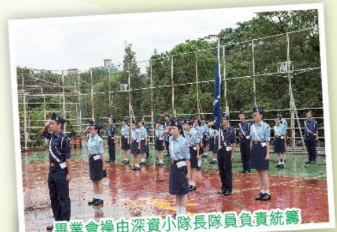
畢業會操由深資小隊長隊員負責統籌

當日同場舉行「導師基本訓練課程畢業會操」，是年度培訓的導師超過200人。課程專為對幼兒、青少年福音工作有興趣之人士而設，為本會培育新一代的導師，參與課程的導師需到分隊實習，把所學知識和技能實踐，作好準備，加入基督少年軍的事奉行列。