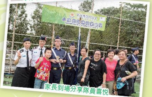
家長到場分享隊員喜悅