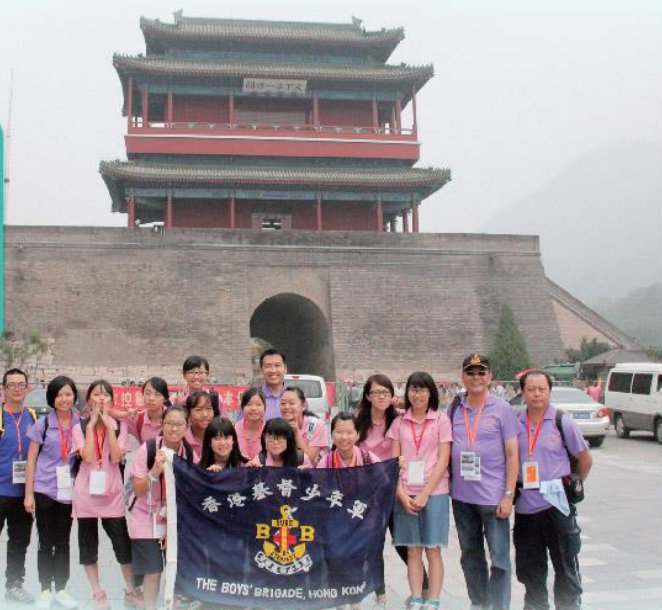
「不到長城非好漢」，隊員成功征服萬里長城

我們在恩施與內地學生有交流的時間，大家自我介紹，聊聊天，然後進入禮堂觀賞表演，表演充分地展示出恩施土族的傳統特色，讓我了解更多土族文化。這次的交流團不但令我對恩施有一定的了解，更能看到嘆為觀止的景色和認識不同的朋友，真是值得！