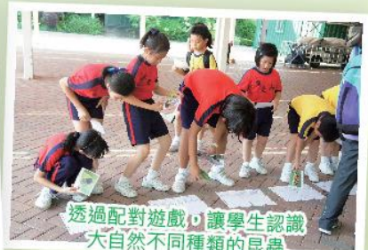
透過配對遊戲，讓學生認識大自然不同種類的昆蟲