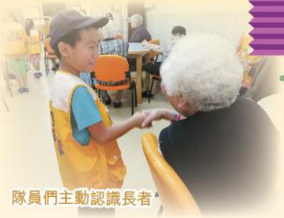
隊員們主動認識長者

Sharity愛共享計劃推行超過10年，當中Sharity的意思是Share the Charity，指分享自己擁有的資源，服侍社會上有需要的人。多年來計劃得到不同分隊、機構、學校踴躍支持，希望藉此活動培養兒童及青少年對長者的愛心，建立關愛的品格。