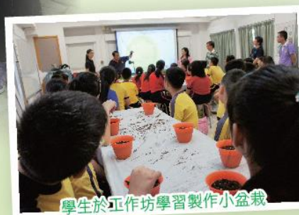
學生於工作坊學習製作小盆栽