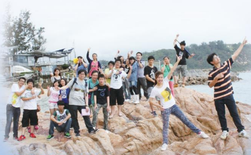
每一次參與分隊活動，隊員都樂在其中

看到隊員們在營裡學會了分享和忍耐，又讓他們與健聽隊員有良好的溝通機會。希望來年的營會可增加多一點基督教元素，好讓隊員能透過活動傳福音，讓身邊人有機會認識信仰。