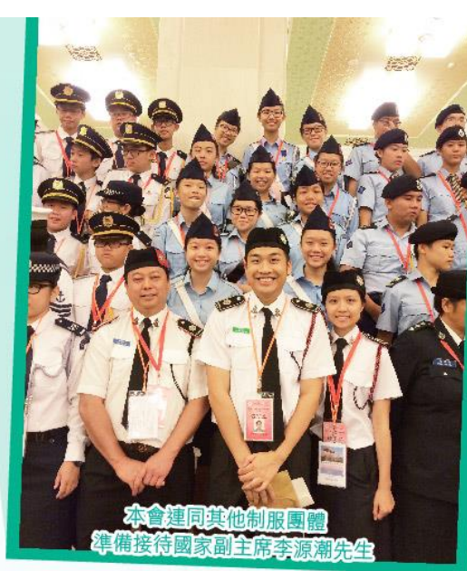
本會連同其他制服團體 準備接待國家副主席李源潮先生

是次活動除了讓隊員觀光、交流，放眼世界外，本會更期盼年輕的一代，可在文化差異中學習、培養多角度思考能力，視野不只局限於香港的一片天空下。