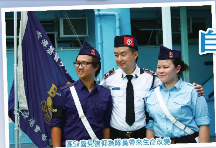
區Sir喜見信仰為隊員帶來生命改變